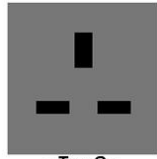
- Typ G -

Souvenirs: Wenn ihr Geschenke oder Süßigkeiten für die Kinder mitbringen wollt, so sprecht dies bitte dringend vorher mit uns und den Guides ab. Es kann sonst zu Tumulten und Verletzungen kommen.